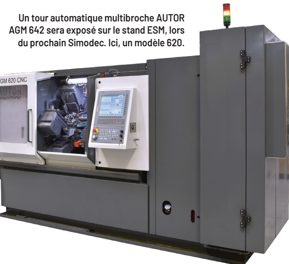
Un tour automatique multibroche AUTOR AGM 642 sera exposé sur le stand ESM, lors du prochain Simodec. Ici, un modèle 620.

Chez AUTOR, ESM exposera le modèle AGM 642. Ce tour multibroche CNC a été reconstruit sur la base d'un bâti GILDEMEISTER Italiana GM42/6, dont les preuves ne sont plus à faire. Cette machine taillée pour la production de pièces simples à moyennement complexes combine la rapidité et la rigidité d'une machine à cames (bâti fonte et barillet mécanique pour barres) et d'une commande moderne avec tous les axes numérisés pour les outils de coupe. Un investissement qui permettra aux entreprises de décolletage, de s'adapter à une main-d'œuvre de plus en plus tournée vers cette commande numérique, en raison du lent remplacement des machines à cames. Plusieurs avantages pour son acquéreur : les porte-outils des machines cames sont réutilisables, une consommation électrique raisonnable de 15 kW, un SAV assuré par les équipes techniques d'ESM. De nombreux modèles ont déjà été acquis par des usieurs italiens (plus de 50 machines à ce jour), notamment en raison d'un prix de vente très attractif. D'autant plus que le constructeur AUTOR fabrique et développe lui-même les appareillages et chariots croisés numériques de ses multibroches AGM. Des accessoires compatibles avec toutes les autres marques de machines-outils multibroches.