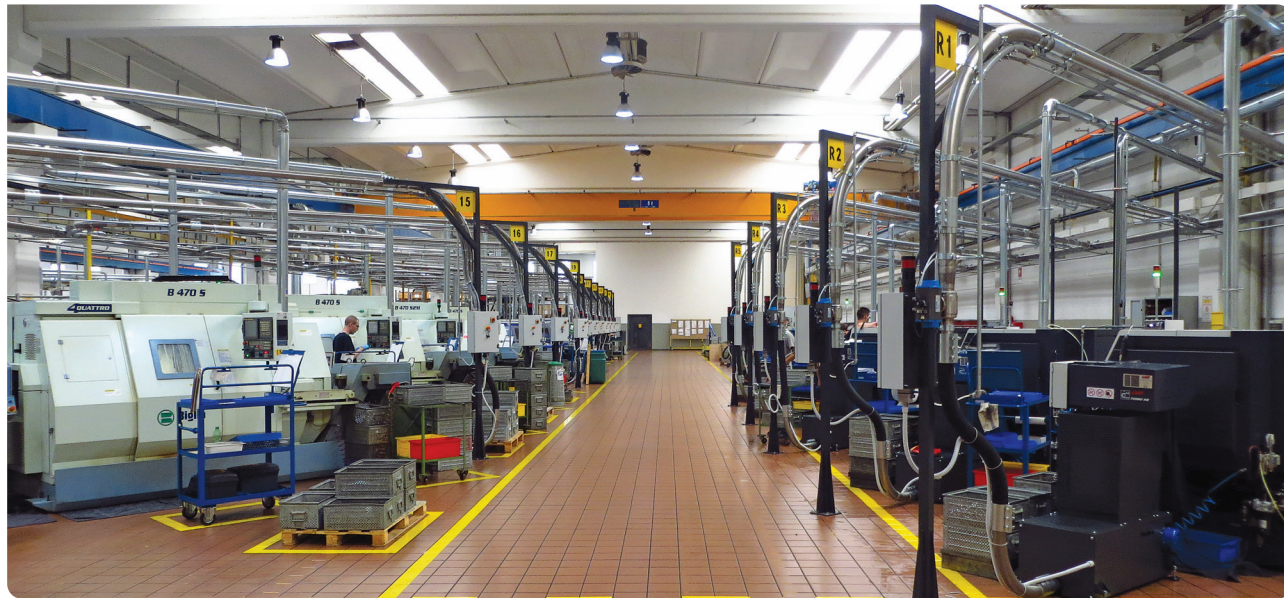
Un atelier de décolletage équipé du système d'aspiration pneumatique des huiles et copeaux de FAMA, dont le module GSM sera exposé au Simodec.

L'entreprise haut-savoyarde spécialisée, depuis plus de 15 ans, dans l'entretien mécanique, électrique et la remise à neuf des tours multibroches GILDEMEISTER Italiana présentera une large gamme de solutions au SIMODEC, du 4 au 8 mars, de la machine-outil CNC à la cellule de contrôle et de tri, en passant par la gestion centralisée des copeaux. A découvrir sur le stand H14/hall B1 de 85 m 2 .